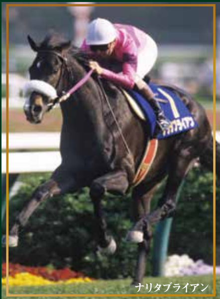
ナリタブライアン