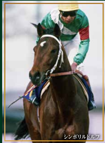
シンボリルドルフ