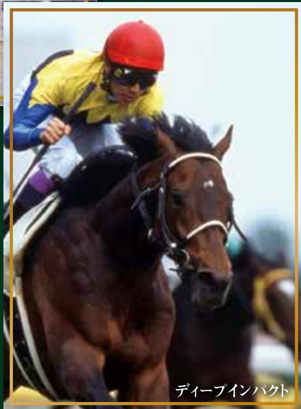
ディーブインパクト