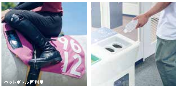
ペットボトル再利用