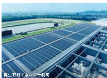
再生可能エネルギー利用