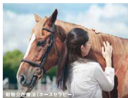
動物介在療法(ホースセラピー)

そんな問いにずっと 向き合い続けてきた私たちJRAは、 いま様々な分野で、 社会貢献活動に取り組んでいます。