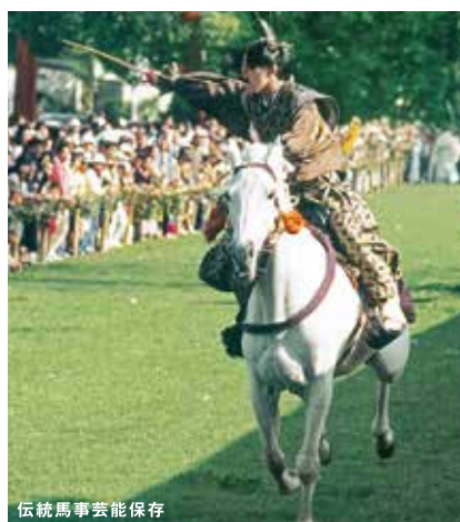
伝統馬事芸能保存