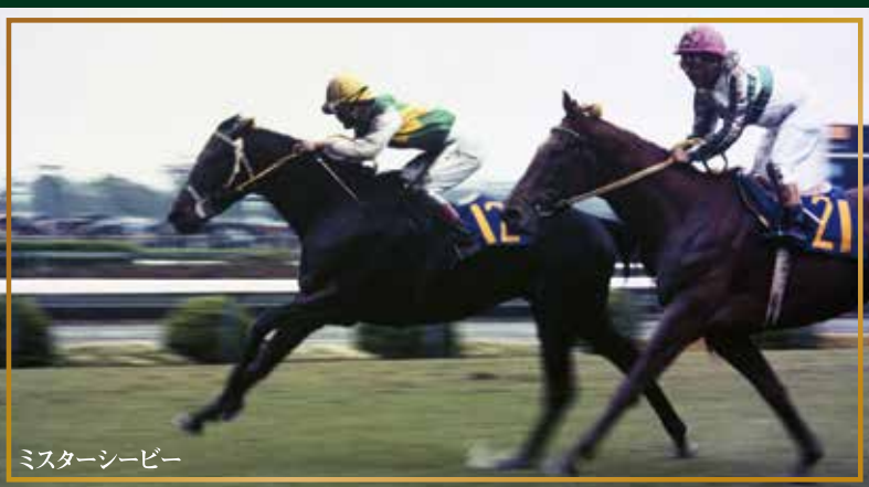
ミスターシービー