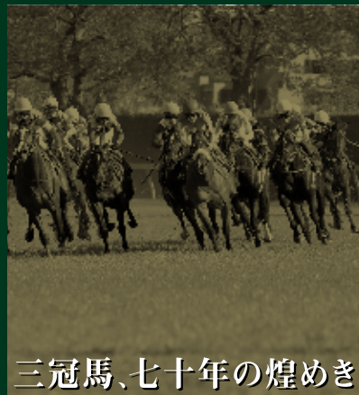
三冠馬、七十年の煌めき